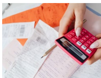
2 Tips voor de ondernemer in de inkomstenbelasting