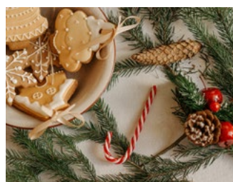
3 Tips voor de bv en de dga