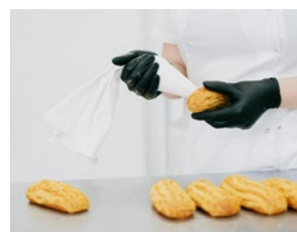
8 Tips inzake belasting-schulden coronacrisis en/of huidige (energie)crisis