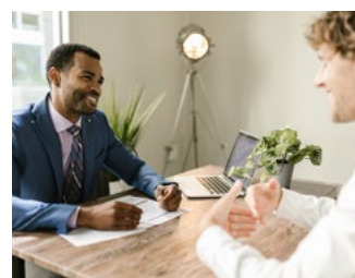
4 Tips voor werkgevers