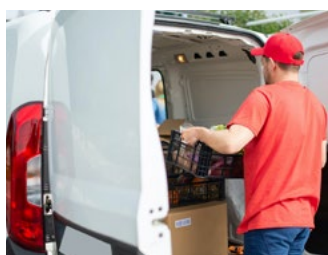
5 Tips voor de automobilist