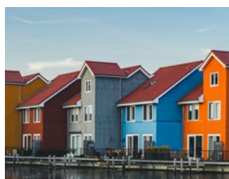
6 Tips voor de woningeigenaar