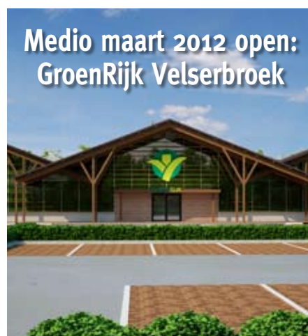
Medio maart 2012 open: GroenRijk Velsbroek

Bent u klant bij De Hooge Waerder en staat uw bedrijf voor een bijzondere gebeurtenis? Neem dan contact op met De Hooge Waerder via (0251) 22 97 52 en wie weet staat uw bedrijf in de volgende editie centraal! •